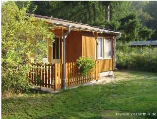
Bungalows Typ IV

Wir bieten Ihnen hier die Möglichkeit, Ihren Urlaub in