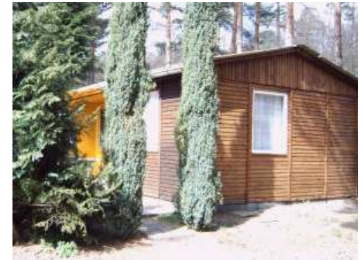
Bungalow Typ III

Alle unsere Bungalows verfügen über jeweils 1-2 Schlafräume, Wohnraum, Küche oder eingebaute Miniküche im Wohnraum, Dusche / WC und Farb-TV.