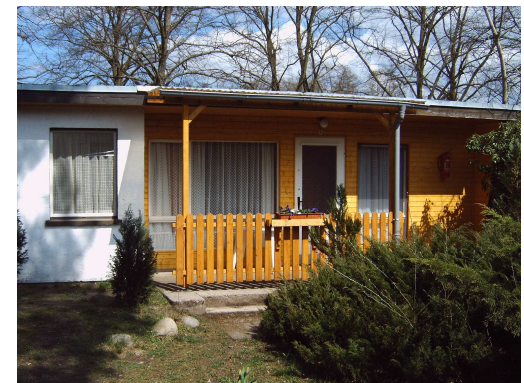
Bungalow Typ I

Alle unsere Bungalows verfügen über jeweils 1-2 Schlafräume, Wohnraum, Küche oder eingebaute Miniküche im Wohnraum, Dusche / WC und Farb-TV.