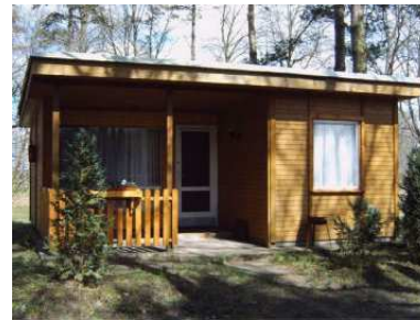
Bungalow Typ II